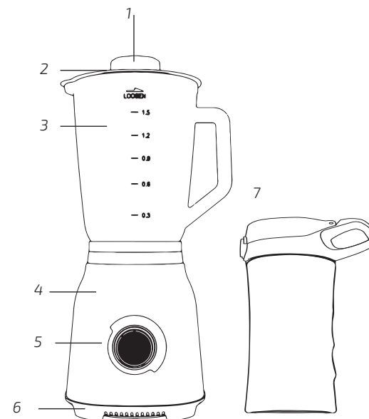
Fig./Img./Abb./Afb./ Rys. 1

Práva duševního vlastnictví k textům v této příručce jsou majetkem společnosti CECOTEC INNOVACIONES, S.L. Všechna práva jsou vyhrazena. Obsah této publikace nesmí být, zčásti nebo jako celek, reprodukován, ukládán do systému obnovy, přenášen nebo distribuován žádnými prostředky (elektronicky, mechanicky, fotokopírováním, nahráváním nebo podobným způsobem) bez předchozího souhlasu společnosti CECOTEC INNOVACIONES, S.L.