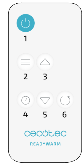
Fig./Img./Abb./Afb./ Rys./Obr. 3