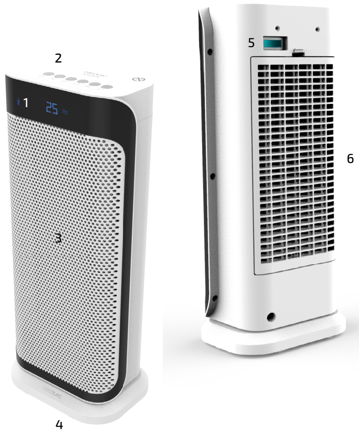
Fig./Img./Abb./Afb./ Rys./Obr. 3